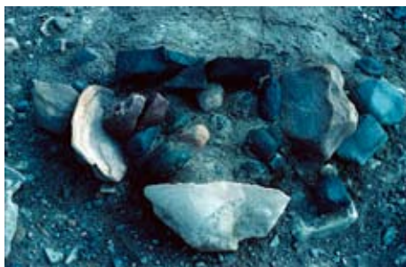
Ildstedet i en Independence I-ruin.