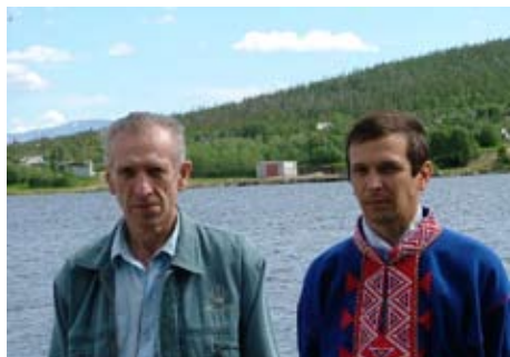
Urfolk i Rusland, her samer på Kolahalvøen