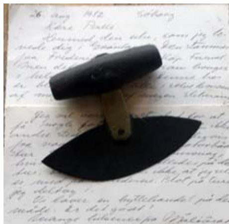
Ulu og brevet